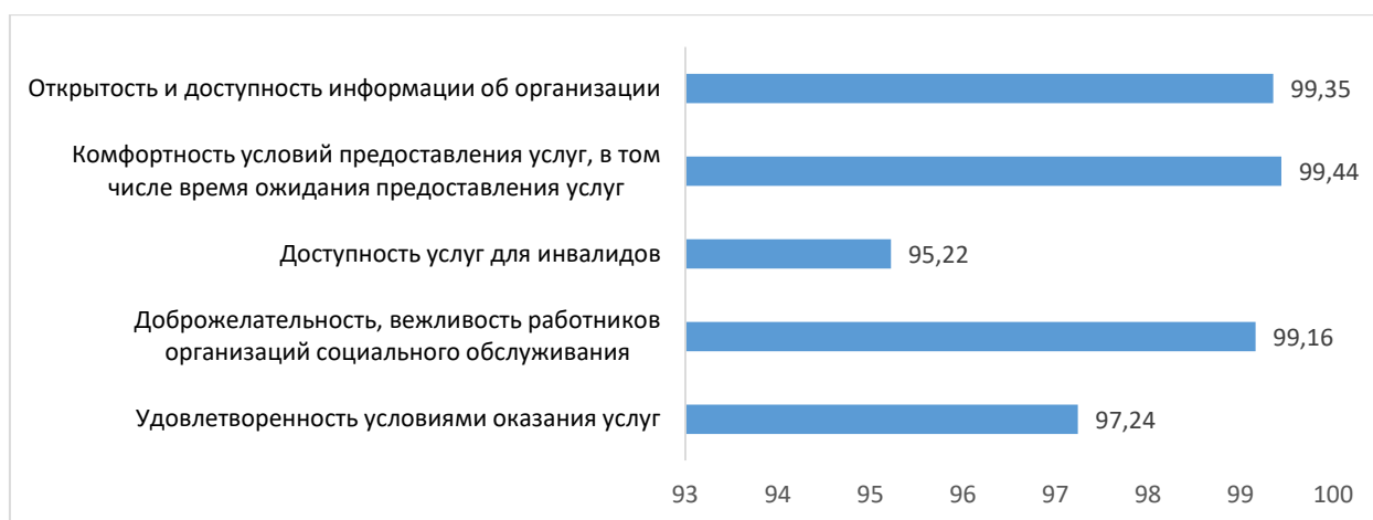
Рис. 2. Средние значения показателей (по 24 государственным организациям социального обслуживания) в разрезе общих критериев независимой оценки (в баллах)

Основными предложениями по улучшению деятельности государственных организаций социальной сферы в автономном округе являются: