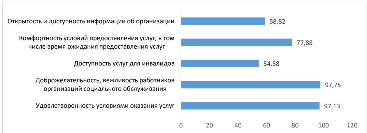
Рис. 3. Средние значения показателей (по 24 негосударственным организациям социального обслуживания) в разрезе общих критериев независимой оценки (в баллах)

В деятельности негосударственных организаций, оказывающих услуги в сфере социального обслуживания, отмечен ряд недостатков в части их информационной открытости: